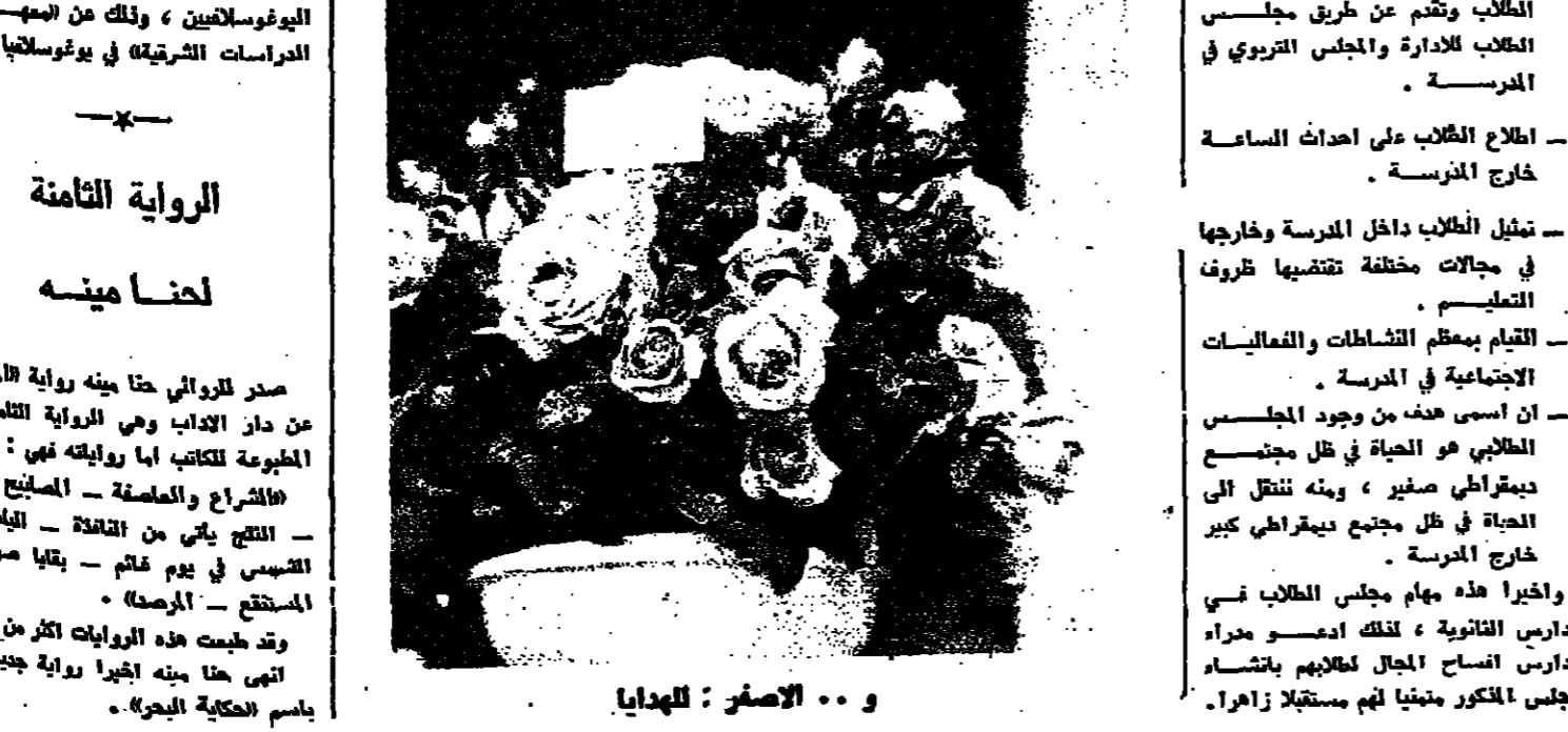
و .. الافر : للهدايا

واخيرا هذه مهام مجلس الطلاب في المدارس الثانوية ، لذلك اتمنى مدراء المدارس اسماح المجال لطلابهم باتتجاه المجلس المذكور مبنيا لهم مستقبلا زاهرا .